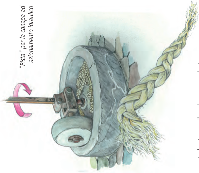
"Pista" per la canapa ad azionamento idraulico

In questa lontana, silenziosa e modesta epopea è contenuto un intero microcosmo: il rapporto con la montagna dura e matrigna che solo la fatica può addolcire; l'abnegazione e il lavoro che diventa quasi sfida quotidiana; le condizioni di vita dei montanari, al limite della pura sussistenza e la loro solitudine di fronte alla montagna e alle sue forze primordiali. Una somma di simboli che racchiude in sé tutta l'idea del lavoro in montagna: l'ideale dunque per dare un nome al nostro Ecomuseo.