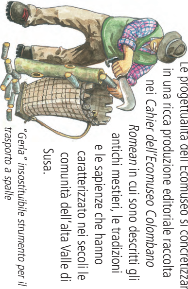
"Gela" insostituibile strumento per il trasporto a spalle

Disegni di Elio Guillano