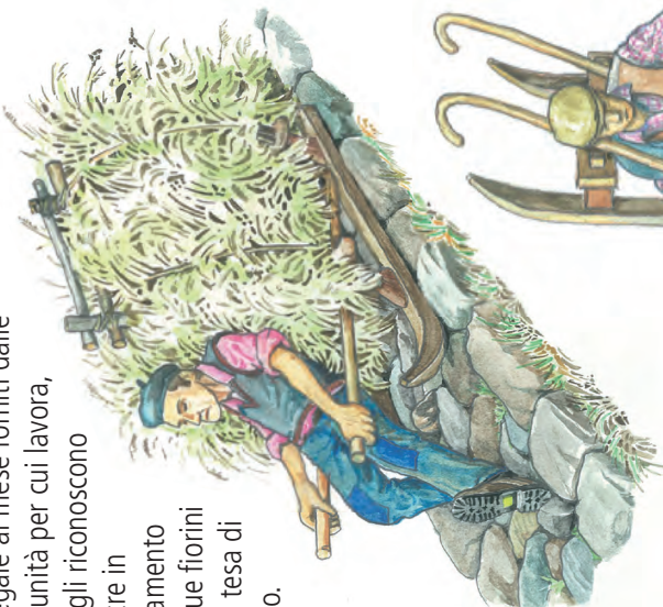
Un tempo il trasporto del fieno si faceva a spalle o con la slitta. Dove possibile si utilizzavano anche carri o funi a sbalzo.

Il Roman, minatore delle Ramats sopra Chiomonte, incomincia nel 1526, in completa solitudine, un'opera quasi incredibile: si tratta del Trou de Touilles, una galleria a 2000 metri di quota lunga circa cinquecento metri con una sezione di circa un metro e ottanta per un metro, che porterà le acque del Rio Touilles a vivificare un intero versante sopra Chiomonte ed Exilles. Per otto lunghi anni Colombano Roman scava solitario con mazze, cunei e picconi nelle viscere della montagna, e vive con due sestieri di vino e due emine di segale al mese forniti dalle comunità per cui lavora, che gli riconoscono inoltre in pagamento cinque fiorini ogni tesa di scavo.