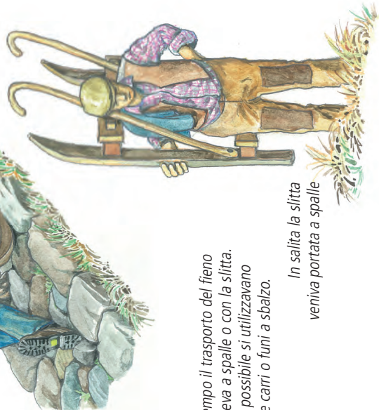
In salita la slitta veniva portata a spalle