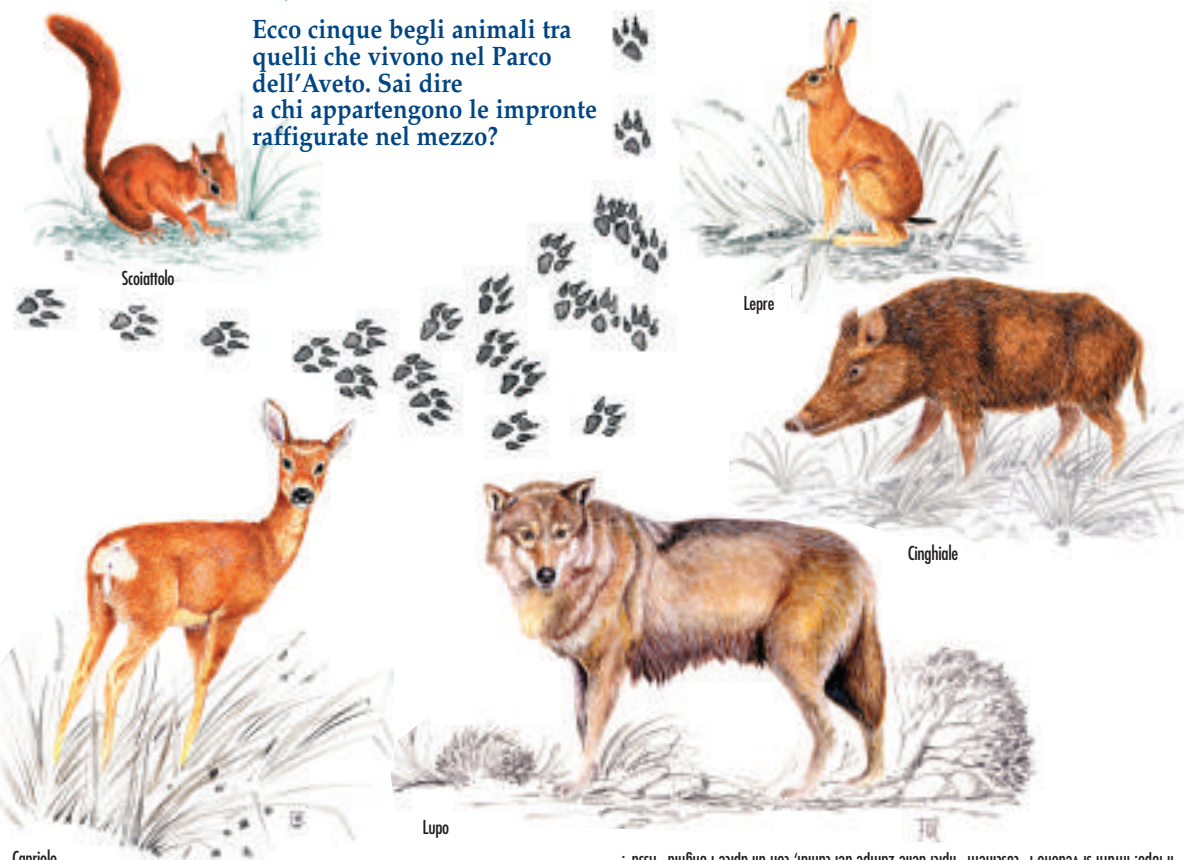
Il lupo: infatti si vedono 5 "rastrellati" tipici delle zampe dei canidi, con all'opere l'unguella "fissa".

Ecco cinque begli animali tra quelli che vivono nel Parco dell'Aveto. Sai dire a chi appartengono le impronte raffigurate nel mezzo?