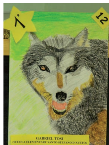
Primo classificato del concorso

Si è svolta sabato 17 dicembre a Rezzoaglio, presso il centro visite del Parco dell'Aveto, la premiazione del concorso di disegno Autunno in Val d'Aveto, colori e forme che scaldano il cuore , che ha coinvolto gli alunni delle scuole di Rezzoaglio e Santo Stefano d'Aveto.