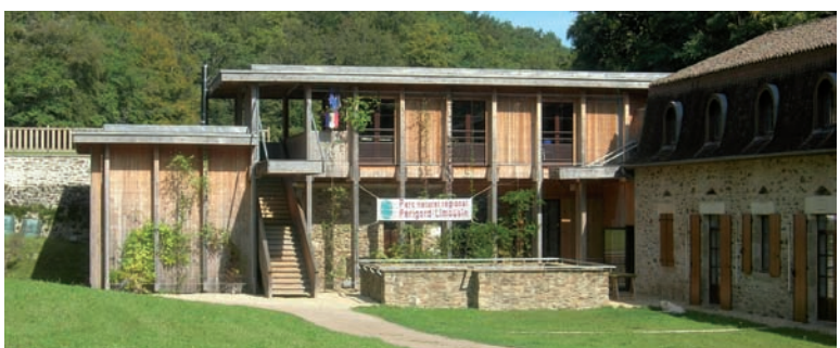
Sede del Parco Naturale del Périgord-Limousin. Partners di progetto in visita a una segheria nel Limousin (Francia).

della Sedia di Chiavari, possibili utilizzatori finali del legname delle nostre foreste per meglio certificare questo prodotto artigianale di eccellenza, e uno con i proprietari e le ditte forestali operanti sul nostro territorio, con lo scopo di individuare problematiche e possibili soluzioni per una gestione e fruizione più agevole e razionale dei boschi. Inoltre è in corso di avvio con le scuole medie inferiori dei comuni del Parco, in collaborazione con il Centro Formazione Professionale del Villaggio del Ragazzo, un percorso educativo finalizzato a far conoscere e promuovere il bosco come ecosistema produttivo e fonte di lavoro, a educare al consumo dei prodotti da esso derivanti e a fornire informazioni e strumenti per l'orientamento verso professioni e/o mestieri di settore. Il Prossimo incontro con i partners si terrà a fine maggio nel nostro Parco, e sarà occasione per promuovere il lavoro svolto e il nostro territorio.